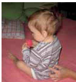
Obr. 2 – Masírování oblasti kolem bederní páteře

b) Je možné, že vaše malé začne lézt a při tom si klekne na kolínka, pak kolena roztáhne a dosedne zadečkem na zem. Možná si myslíte, že takto vypadá samostatný sed, ale tak tomu není (viz obr. 4). Tento posed