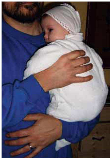
Obr. 2 - Špatné držení dítěte

Při nošení děťátka preferujte polohu v klubíčku (viz. obr. 3), kdy je miminko o vás opřené zádičky.