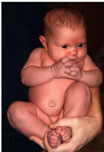
Obr. 1 - Uchopení dítěte jednou rukou

Vezměte ho pod hrudníčkem, hlavička se mu převáží a bradička se opře o hrudníček.