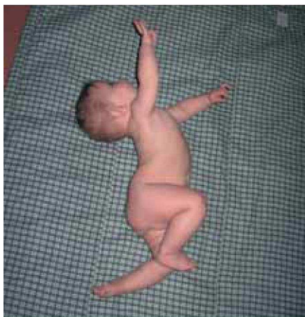
Obr. 2 – Chybné přetáčení na břicho

které se pak velmi těžko přepisují. Nebojte se, jestliže se vaše malé hodně zaklání při přetáčení, neznamená to, že bude hendikepované! To ne, jen potřebuje teď pomoci a zkušená fyzioterapeutka či rehabilitační sestra vám ukáží jednoduchá podpůrná cvičení. Dalšími výbornými pomocnicí jsou masáže, plavání a polohování na gymnastickém míči a over ballu.