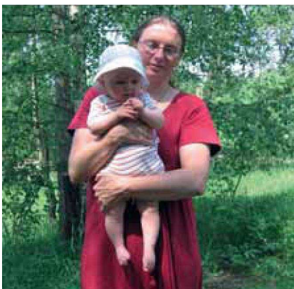
Obr. 4 – Úchop za natažené nožičky