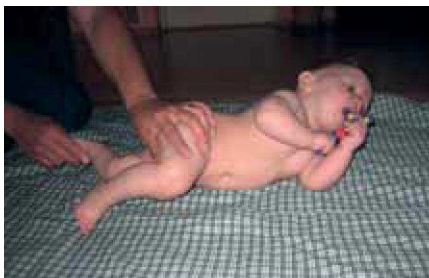
Obr. 3 – Pomoc při přetáčení na břicho

zoubek. Děťátku můžete ulevit homeopatiky a nebo olejíčkem s heřmánkem, který moc pomáhá ulevit od bolesti. Olejíček natřete několikrát kolem pusinky, doporučuji používat přírodní esence, jsou sice dražší, ale účinek je nesrovnatelný. Nobilis Tilia má pro tyto účely produkt Jakoubek.