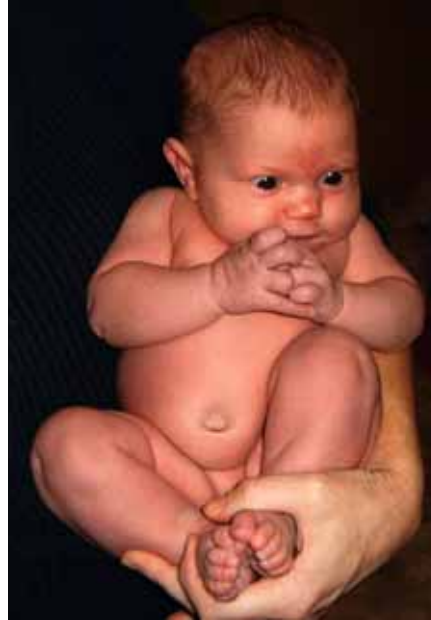
Obr. 1 - Uchopení dítěte jednou rukou

Vezměte ho pod hrudníčkem, hlavička se mu převáží a bradička se opře o hrudníček.