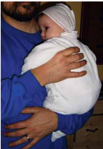
Obr. 2 - Špatné držení dítěte

nete v klubičku. Až bude velké, poděkuje vám za pevné a zdravé tělo, jehož základy se budují od narození do jednoho roku věku.